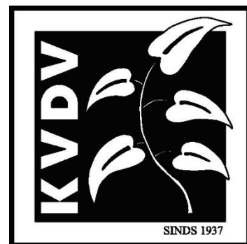
▼ Logo KVDV sedert ± 2007