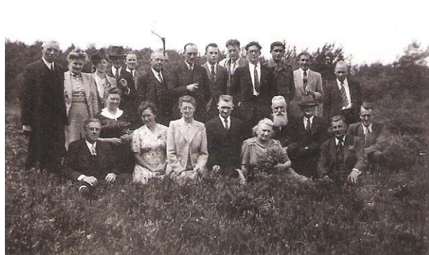
Uitstap Belgen en Nederlanders (1948)