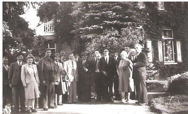
Uitstap Belgen en Nederlanders (1948)