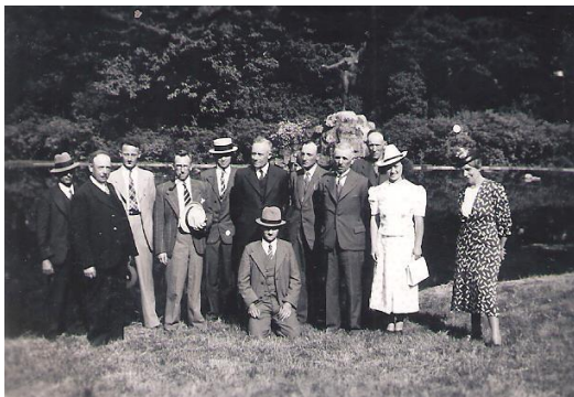
Uitstap naar Mariemont (1939)