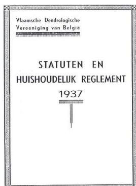
Statuten KVDV van 1937