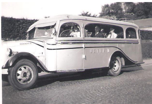
Vervoer voor Mariemont (1939)